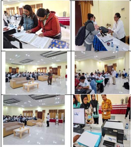
Dokumentasi Bimtek Pengelolaan Perpustakaan di Kabupaten Suroboyo